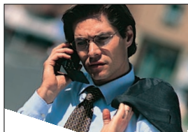
Allarme ricevibile anche sul cellulare.