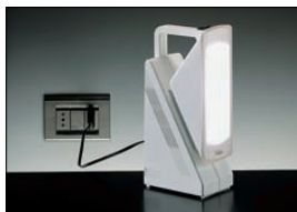
Collegata alla rete elettrica si accende in caso di black-out.