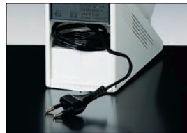
Con cavo di alimentazione a scomparsa, si trasforma in lampada portatile.