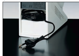
Con cavo di alimentazione a scomparsa, si trasforma in lampada portatile.