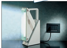
Collegata alla rete elettrica si accende in caso di black-out.